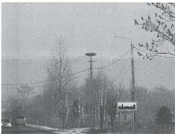
Zdj. 4. Nowosady