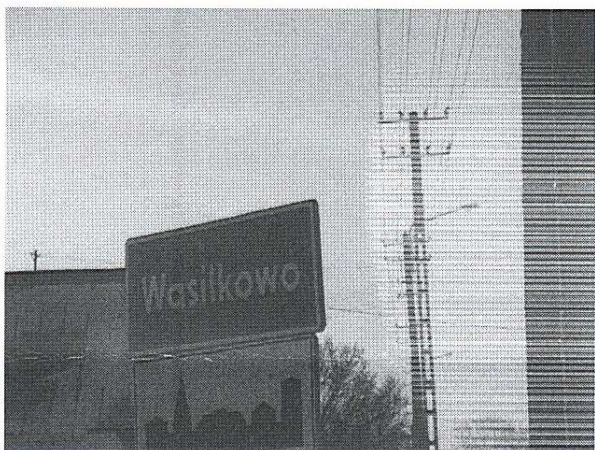
Zdj. 3. Wasilkowo