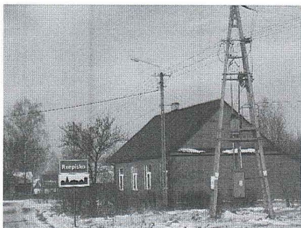
Zdj. 5. Rzepiska